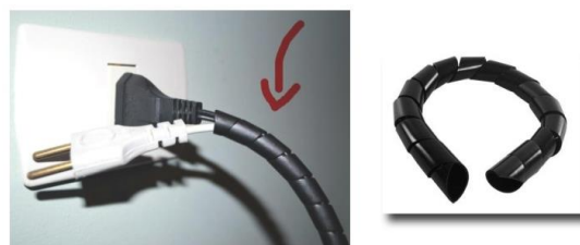
Protetor de fios

Uma mordida num fio elétrico pode causar queimadura e até mesmo parada cardíaca devido ao choque. Sugerimos protetores de fios chamados "Organizador de Fios", que podem ser encontrados em supermercados ou lojas de materiais elétricos. Mesmo assim, recomendamos cautela.